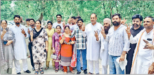
फतेहाबाद। ब्लॉक समिति जाखल अध्यक्ष व उपाध्यक्ष चुनाव को लेकर हुई बैठक में मौजूद अधिकारी व जीत के बाद समर्थकों सहित विजय चिन्ह बनाते ब्लॉक समिति जाखल अध्यक्ष व उपाध्यक्ष।