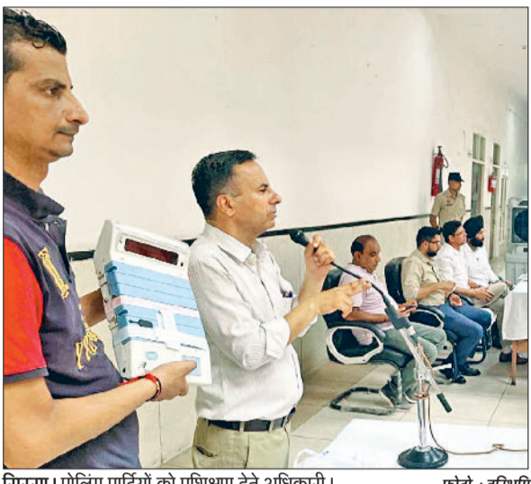
सिरसा। पोलिंग पार्टियों को प्रशिक्षण देते अधिकारी।