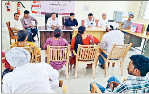
फतेहाबाद। ब्लॉक समिति जाखल अध्यक्ष व उपाध्यक्ष चुनाव को लेकर हुई बैठक में मौजूद अधिकारी व जीत के बाद समर्थकों सहित विजय चिन्ह बनाते ब्लॉक समिति जाखल अध्यक्ष व उपाध्यक्ष।