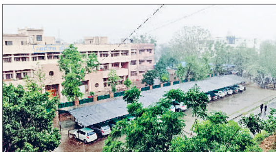
फतेहाबाद। शहर में हुई हलका बूंदाबांदी।

पिछले दो दिनों से प्रदेश के अनेक जिलों में प्री मानसून की बरसात हुई है। एक-दो क्षेत्रों को छोड़कर फतेहाबादवासी बौछारों की इंतजार में मायूस हैं। मंगलवार को तेज धूप और उमस से लोग बेहाल दिखाई दिए। इन दिनों यहां का तापमान 36 से 38 डिग्री के पास घूम रहा है जबकि मानसून आने