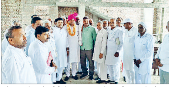
फतेहाबाद। बैठक में अतिथियों का स्वागत करते प्रजापति समाज के लोग।

प्रजापति समाज ने प्रदेश सरकार से खाली पड़े माटी कला बोर्ड का चेयरमैन बनाने की मांग