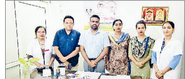
टोहाना। बैठक में मौजूद एसएमओ डॉ कुणाल व मंगलामुखी।