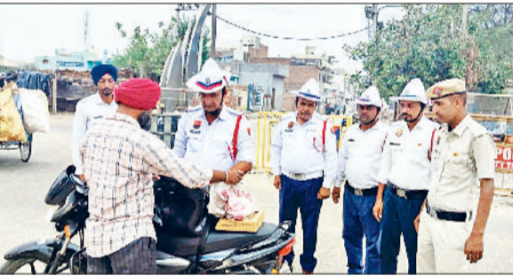
फतेहाबाद। वाहनों की जांच करते ट्रैफिक पुलिस कर्मचारियों।